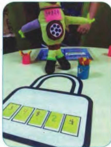
Решили задачки – отгадали код от замка

Когда все задачи решены, помощник становится добрым и показывает верный код. Дети сверяют код, затем отыскивают деталь пазла.