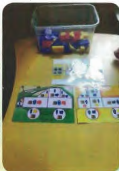
Составляют по схеме вездеходы