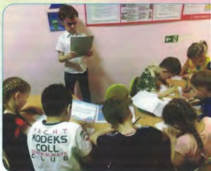
Графический диктант проводит Помощник Колдуньи

Дети по карте отправляются к следующему испытанию.