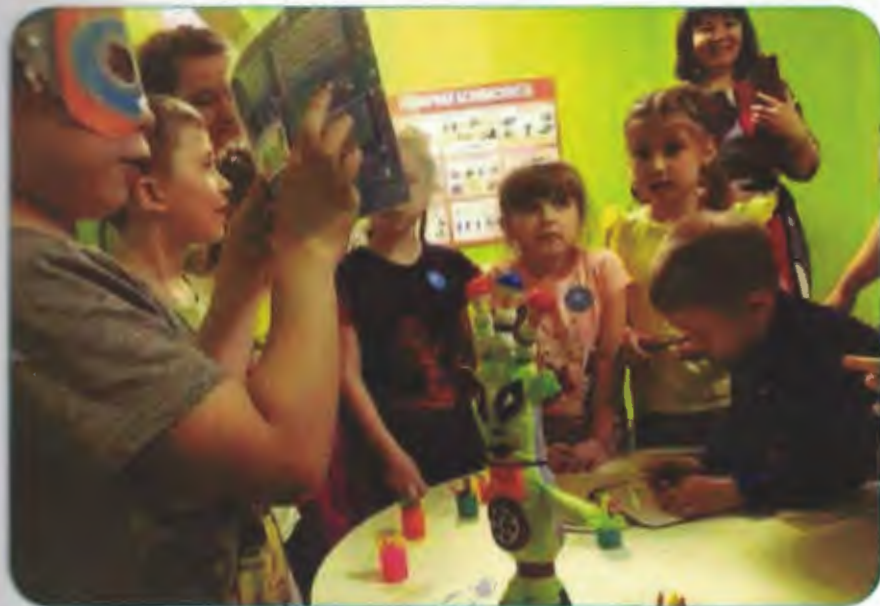
Помощник Колдуньи читает задачки

Пять малышей - медвежат Мама уложила спать. Одному никак не спится. А скольким сон хороший снится? (четыре)