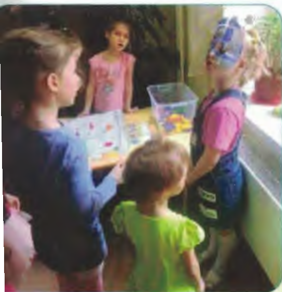
Помощник Злюки Тринадцатой объясняет задание

Дети по карте отправляются к следующему испытанию.